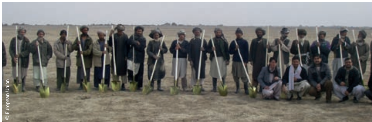
Afgánok szerszámokat kapnak annak az ECHO által finanszírozott intézkedésnek a keretében, amely az országot éhínséggel sújtó és sokakat lakóhelyük elhagyására kényszerítő szárazság következményeit hivatott enyhíteni

A humanitárius segítségnyújtással és a polgári védelemmel kapcsolatos európai uniós szakpolitika jogalapját a Lisszaboni Szerződés hozta létre, mely 2009. december 1-jén