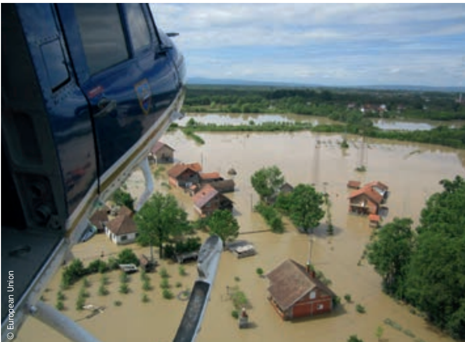
Az uniós polgári védelmi mechanizmus keretében szlovén helikopter nyújt vészhelyzeti segítséget az áradások sújtotta területek lakosságának Bosznia-Hercegovinában

Az EU tagállamai által az uniós polgári védelmi mechanizmuson keresztül nyújtott természetbeni segítségen kívül az Unió 3 millió euró összegben juttatott humanitárius támogatást a két ország legkiszolgáltatottabb helyzetben lévő lakosainak megsegítésére. Ennek köszönhetően félmillió ember részesült humanitárius támogatásban a két országban, ahol azonban továbbra is nagyon sok még a tennivaló a helyreállítás és az újjáépítés terén.