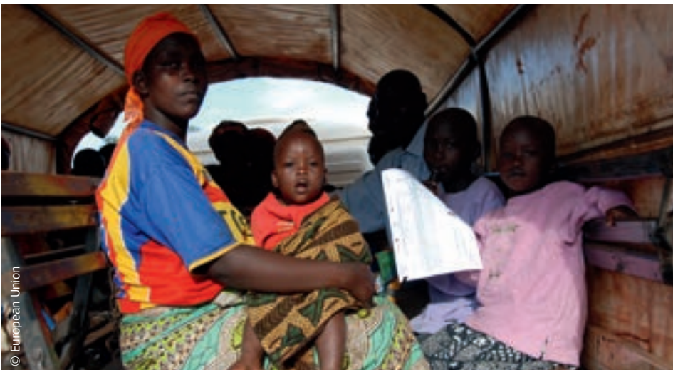
Ez a burundi család az EU visszatelepítési támogatásának köszönhetően visszatérhetett lakhelyére, amelyet korábban elhagyni kényszerült

Annak érdekében, hogy a katasztrófák hosszabb távon jelentkező hatásait kezelni lehessen, és hogy javítani lehessen a megelőzést és a felkészülést, a humanitárius segítségnyújtásnak és a válságkezelésnek együtt kell járnia más területeken végzett egyéb tevékenységekkel, ideértve a fejlesztési együttműködést és a környezetvédelmet is. Ennek a követelménynek csak akkor lehet megfelelni, ha az egyes tevékenységeket uniós szinten koordinálják.