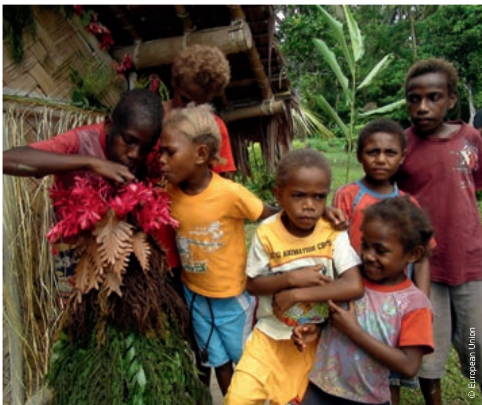
Vanuatun a gyerekek is segítenek annak a modellnek a megépítésében, mely az életükre legnagyobb veszélyt jelentő Gharat-vulkánt hivatott ábrázolni

Az Európai Bizottság által az ellenálló képesség javítása érdekében tett törekvéseknek köszönhetően a jövőben több ember életét lehet majd megmenteni, javulni fog a költséghatékonyság, és csökkenni fog a szegénység. Mindez növelni fogja a segélyezés hatásfokát, és elősegíti a fenntartható fejlődést.