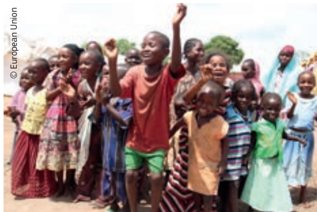
Az oktatás segít abban, hogy a konfliktus sújtotta területeken élő gyerekek gyerekek maradhassanak

által megvalósított projektek révén – az eddigiek folyamán több mint 108 000 gyermeknek segített a világ 12 országában: Pakisztánban, a Kongói Demokratikus Köztársaságban, Etiópiában, az oda menekült szíriai menekültek esetében Irakban, Dél-Szudánban, Csádban, a Közép-afrikai Köztársaságban, Szomáliában, Afganisztánban, Mianmarban, Kolumbiában és Ecuadorban.