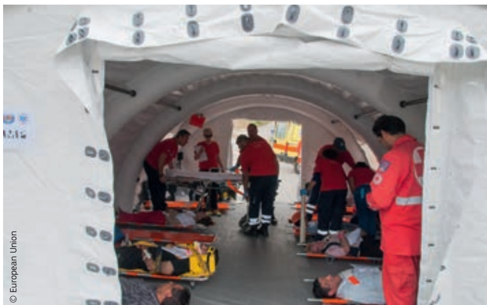
A 2014. évi uniós polgári védelmi gyakorlat, a Prometheus azt volt hivatott tesztelni, milyen együttműködési és veszélyhelyzeti-reagálási képességeket tudnak a tagállamok mozgósítani

A korábbi szimulációs gyakorlatokon kipróbált forgatókönyvek között szerepelt egy másik – vonatfékezéskor keletkező szikra által okozott – erdőtüz, és olyan, áradás miatt kialakult vészhelyzet, amikor is gátszakadás miatt egy környékbeli falu víz alá kerül. Ilyen típusú gyakorlatokra minden évben sor kerül az Európai Unió által biztosított pénzügyi támogatásnak köszönhetően.