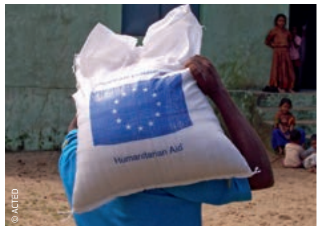
Az EU 1996 óta nyújt humanitárius segítséget Indiának

Napjainkban újabb és újabb globális fenyegetésekkel kell szembenéznünk. Ha meg akarunk felelni az új kihívásoknak, elengedhetetlenül fontos, hogy folyamatosan alkalmazkodjunk a változó körülményekhez. A válságreagálás hatékonyságának javítása érdekében az EU 2010-ben egyetlen főigazgatóság hatáskörébe utalta a humanitárius segítségnyújtással és a polgári védelemmel kapcsolatos feladatokat.