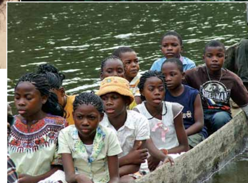
Az Afrikáért Alapítvány árvái a Bonobo Rezervátum taván csónakáznak

Amikor Afrikába indultam október elején, a legtöbben azzal eresztettek utamra: egy cuki fekete babát örökbe fogadhatnék. Volt, aki hozzátette: ott úgy sincs esélye normális életre. Sok gyönyörű afrikai gyerek van, kétségtelenül, de vajon az a legjobb módja a segítségnek, ha fehér emberek Európába hozzák őket? Nem biztos. De az igen, hogy kitűnő üzlet afrikai gyerekekkel „kereskedni”.