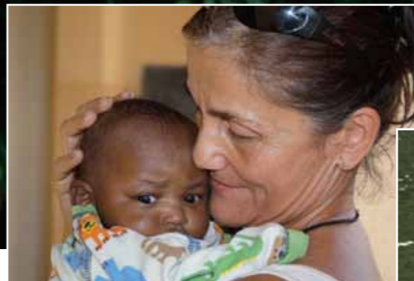
A TAITA Alapítvány Kenyában fenntartott árvaházának legfiatalabb lakóját pár naponan tették egy templom lépcsőjére